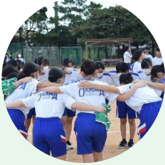
部活動や校内行事が盛んな 「沖縄中」